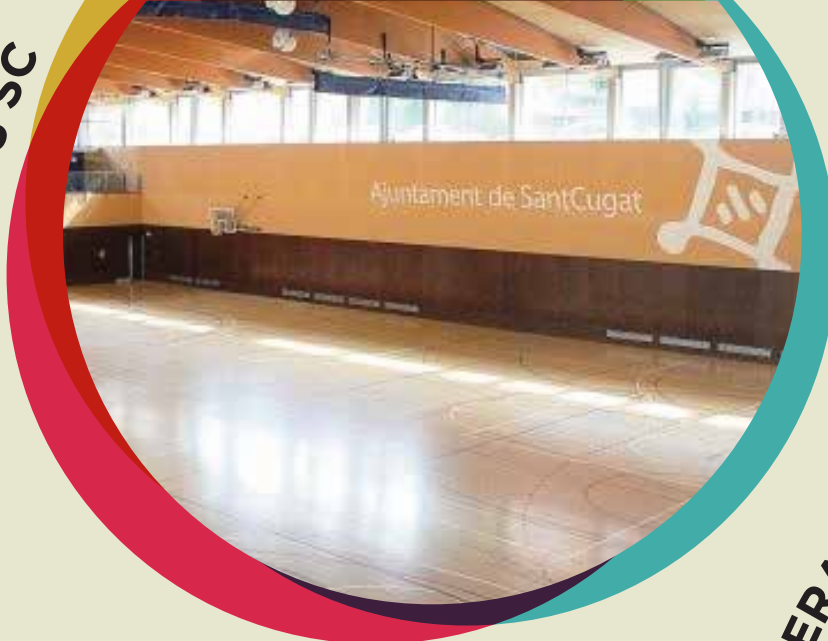
PAV LA GUINARDEA